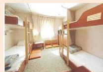
スタンダードルーム