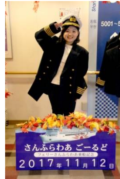
【記念撮影コーナー】

↑レストラン特別スペースで開催された三味線&西方小天鼓コンサートで船内は大盛り上がり。