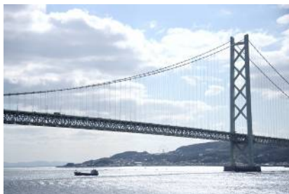
<通航 11:40頃>明石海峡大橋

神戸港から大分港に着くまでに、3つの大橋をくぐり抜けます。 急接近する瞬間は、その迫力に大興奮！ 船上からでなければ見られないベストショットが撮れるチャンス☆