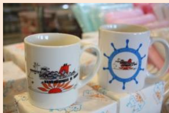
【オリジナルグッズ】