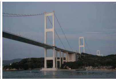
<通航 17:26頃>来島海峡大橋