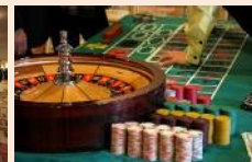
ルーレットコーナー