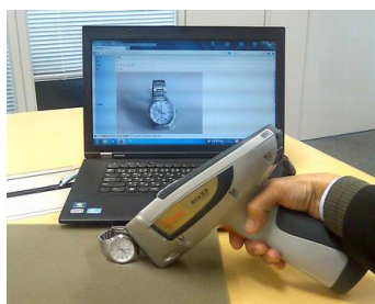
+ 理化学的に測定する同定度判定システムで補完