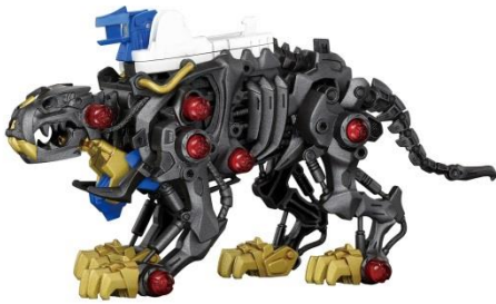
リアリティを追及した骨格デザイン