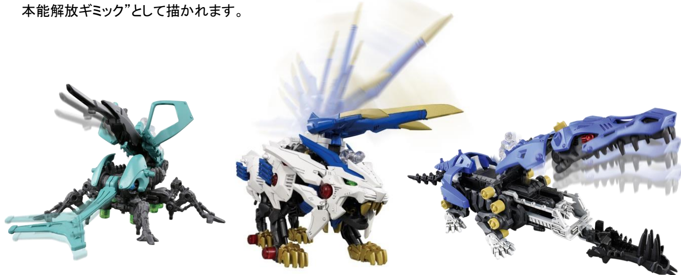
ワイルドブラストの一例

アニメやまんがの中では、“ゾイドと人とが人馬一体となり、互いの闘争本能が最高潮に達して発動する闘争本能解放ギミック”として描かれます。