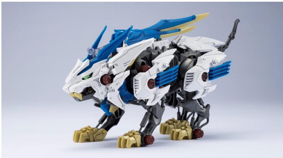
ゾイドワイルド「ZW01 ワイルドライガー」

その玩具展開として、新たなデザインとギミックを取り入れたリアルムービングキット(組立式駆動玩具)「ゾイドワイルド」シリーズを2018年6月から全国の玩具専門店、百貨店・量販店の玩具売り場、インターネットショップ、そしてオフィシャルショップ「ゾイドベース」等にて発売いたします。