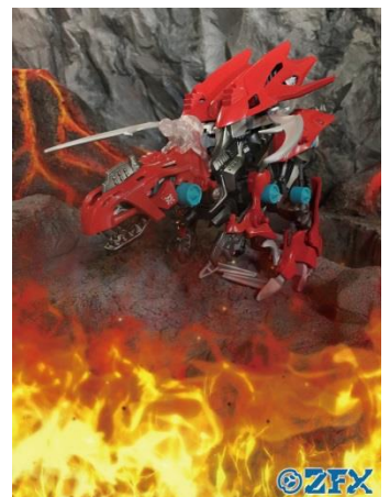
専用アプリで作成したオリジナル動画(イメージ)