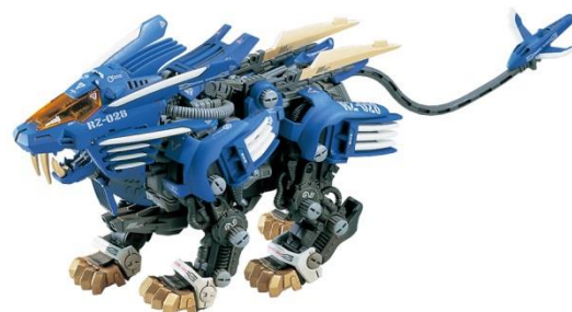
「フレードライガー」 (2000年発売 当時価格2200円)

第1期のモデルをベースにしながらアニメとも連動した玩具は、第1期に引き続き当時の子どもたちの間で人気となった。1999年から2006年の間に4つのテレビアニメシリーズが放送され、日本国内と海外展開を合わせて、2500万体制以上が出荷された。