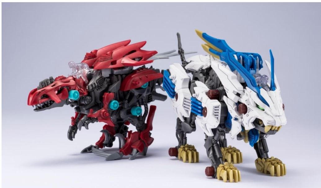
ゾイドワイルド「ZW01 ワイルドライガー」(右)