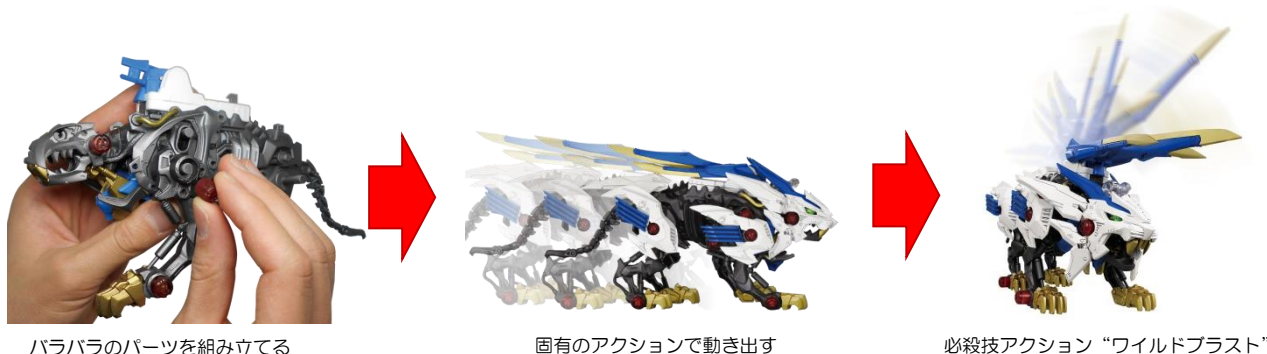
バラバラのパーツを組み立てる