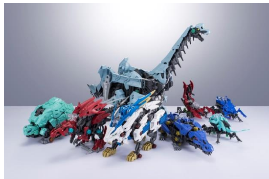
「ゾイドワイルド」商品

玩具、テレビアニメ、まんが、ゲーム、アプリなどのメディアミックス展開もさらに強化された。