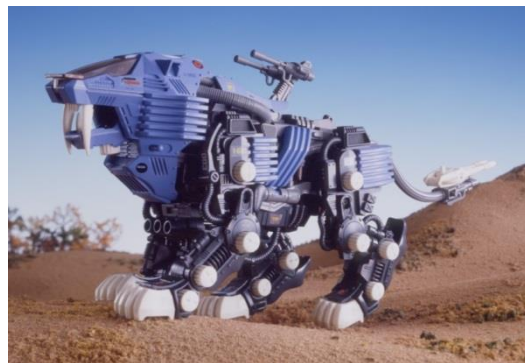
「シールドライガー」 (1987年発売 当時価格1980円)

当時のプラキットは接着剤を使用するものが主流だったが、ゾイドは子どもが組み立てやすいように接着剤を使わなくてもゴムキャップで組み立てられる方式を採用した。その簡単な組み立てと、ゼンマイやモーターを動力としてリアルに歩くアクションと秀逸なデザインが当時の子どもたちの間で絶大な人気を博した。日本国内で1900万体制以上が出荷された。