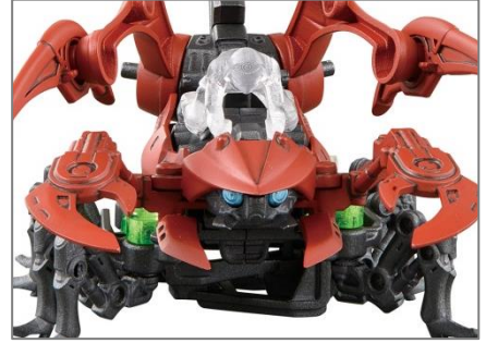
人間フィギュアの搭乗例