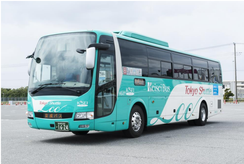
Vehicle exclusively used for Tokyo Shuttle (Narita Airport ⇄ Tokyo Station / Ginza)