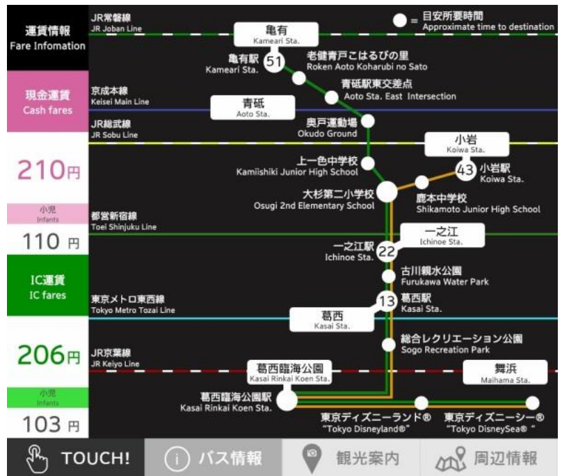
Digital signage (Kasai Rinkai Koen Station)