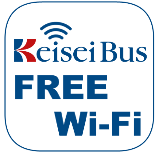
Free Wi-Fi connectivity logo