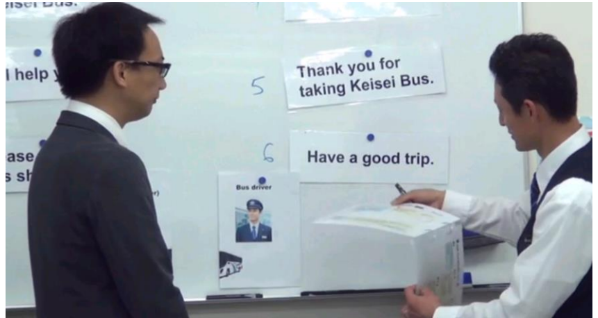
A photo from a training session for drivers