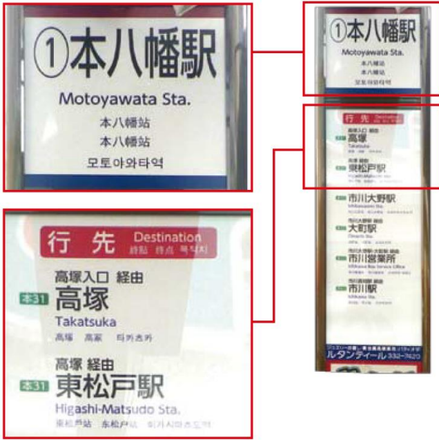
A route bus stop (Motoyawata Station)