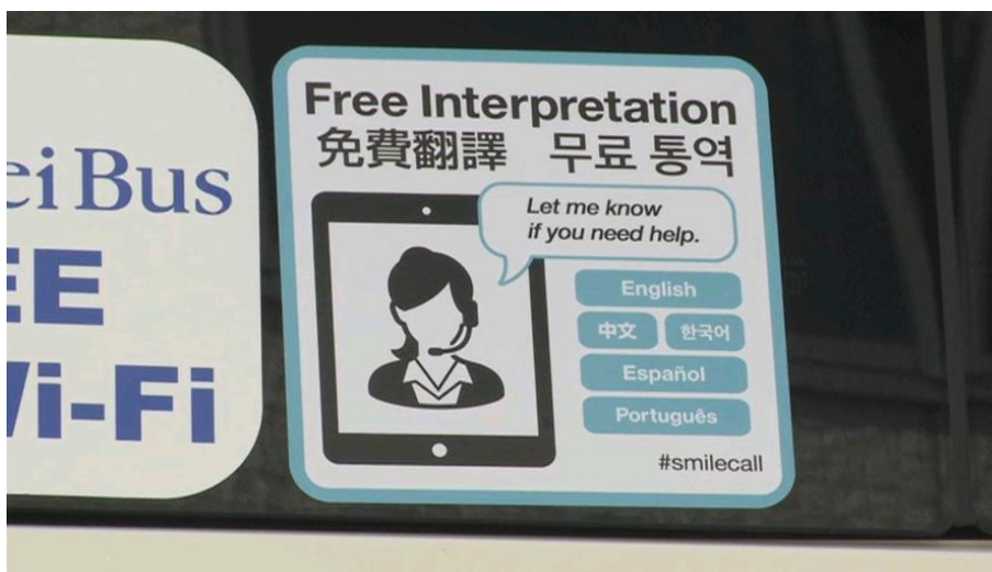
Utilizing interpreting service via smartphone