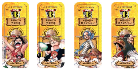
東の海編 A、東の海編 B、アラバスタ編 A、アラバスタ編 B