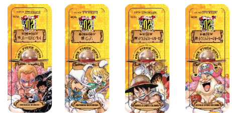
ドレスローザ編 B、ゾウ編、ホールケーキアイランド編 A、ホールケーキアイランド編 B