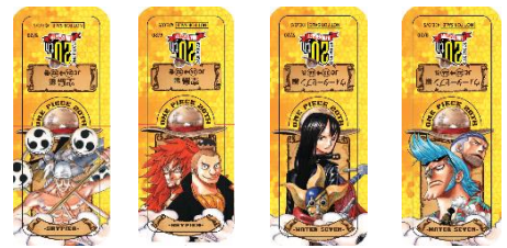
空島編 A、空島編 B、ウォーターセブン編 A、ウォーターセブン編 B