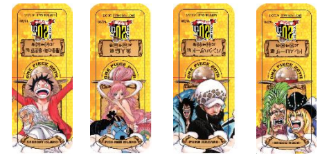
最後の海・新世界編、魚人島編、パンクハザード編、ドレスローザ編 A