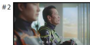
黒坂 進次郎 変えなきゃな。