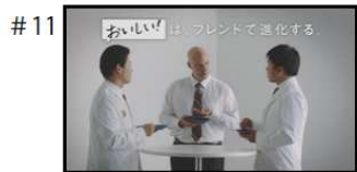
【Na】 おいしい!は、 ブレンドで進化する