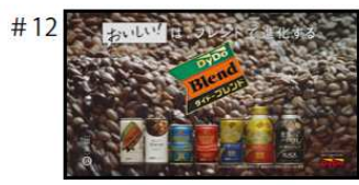
ダイドーブレード