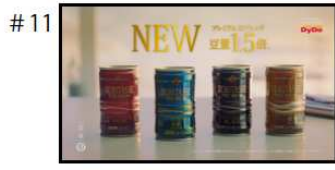
【Na】 ダイドーブレード デミタス