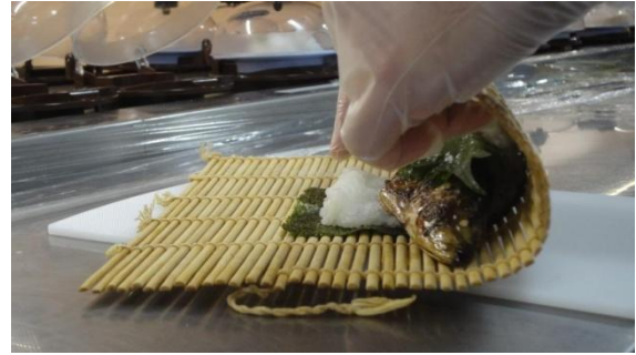
恵方巻は店舗で一本ずつ手巻きします