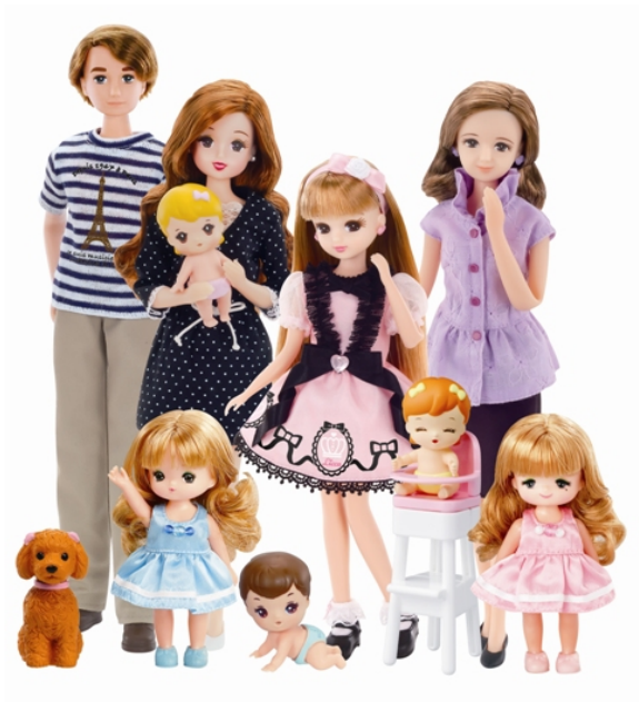
リカちゃんファミリー

名前 : 香山洋子(かやま ようこ) 誕生日 : 10月10日 星座 : てんびん座 年齢 : 56歳 趣味 : 料理・お菓子作り 好きな花 : バラ 職業 : 「ロイヤルローズ」という名のお花屋さん&カフェのオーナー