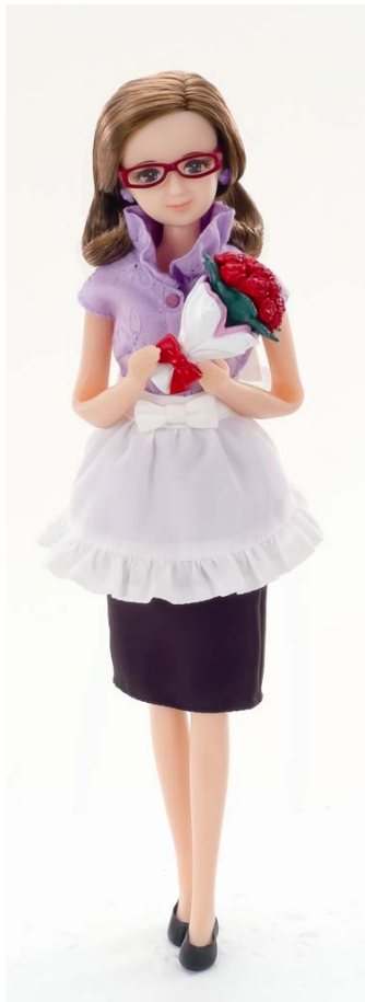
「だいすきなおばあちゃん」