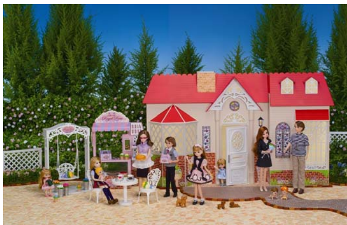
（右）「リカちゃんハウス グランドドリーム」 （左）「お花がいっぱいケーキ屋さん」＊人形は別売

1967年（昭和42年）の誕生から今年で45年、「リカちゃん」は常に時代や流行を反映しながら、少女たちの憧れや夢の暮らしを形にした商品を発売してまいりました。ファッションや職業のほか、家族もその時代を表現しています。1969年（昭和44年）に登場したママ（織江）はファッションデザイナーという時代の先端を行くビジネスウーマンでした。一方パパ（ピエール/フランス人）は、しばらく不在でしたが、20年後の1989年（平成元年）に発売となりました。これは、高度成長期、モーレツに働く日本の父親像から、週休二日制の導入なども相まって「マイホームパパ」が登場したことが背景にありました。