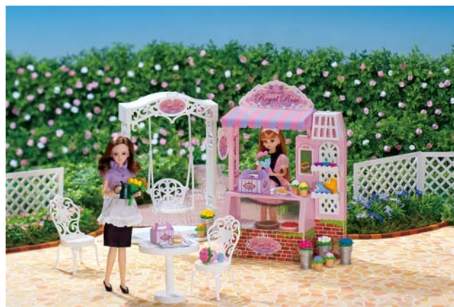
『お花がいっぱいケーキ屋さん』