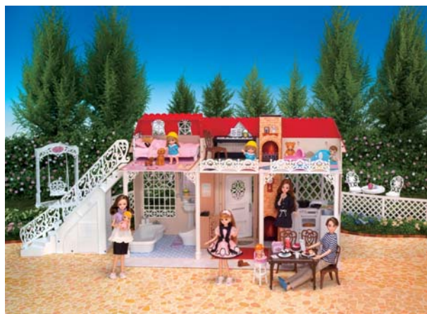
『リカちゃんハウス グランドドリーム』

③商品名 『リカちゃんハウス お花がいっぱいケーキ屋さん』 発売日 2012年4月26日(木) 希望小売価格 3,990円/税込 商品内容 本体、ブランコ、テーブル、椅子(2)、花・ケーキ小物、紙小物 商品サイズ W405×H320×D145(mm) 販売目標 初年度5万個